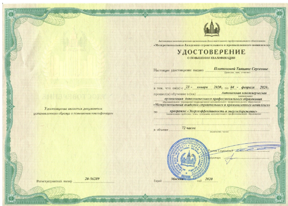
Удостоверение о повышении квалификации специалистов-энергоаудиторов