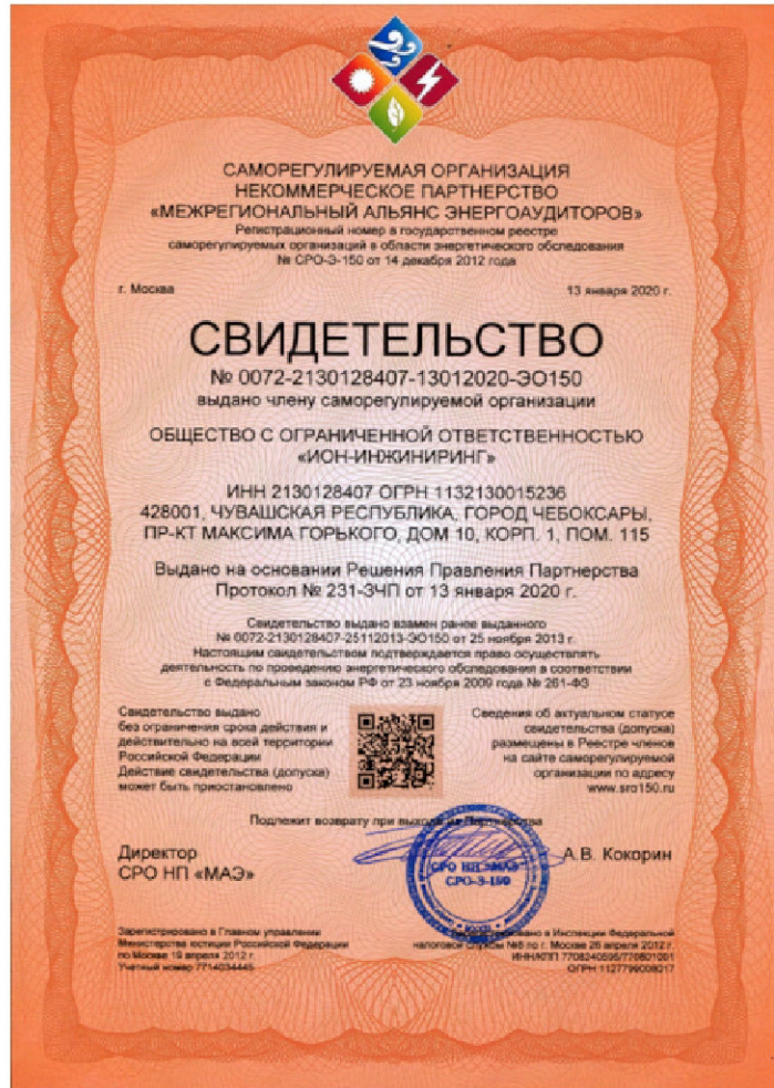
Свидетельство о допуске к работам в области энергетического обследования